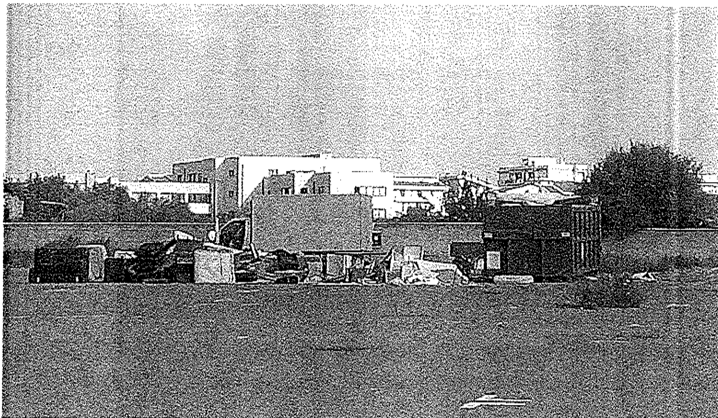
Foto interno Palazzetto del 20 settembre 2019 .