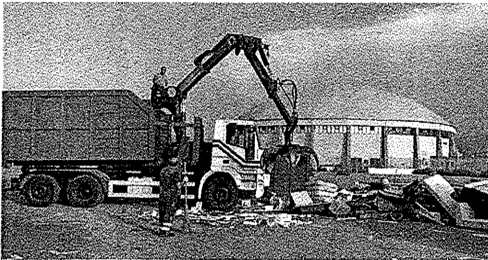
Gli operai della Super Eco rimuovono il materiale ingombrante nell'area del palazzetto